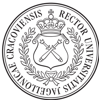
Pieczęć mniejsza Uniwersytetu Jagiellońskiego (średnica 45 mm)