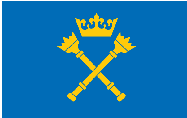
Wzór flagi Uniwersytetu Jagiellońskiego