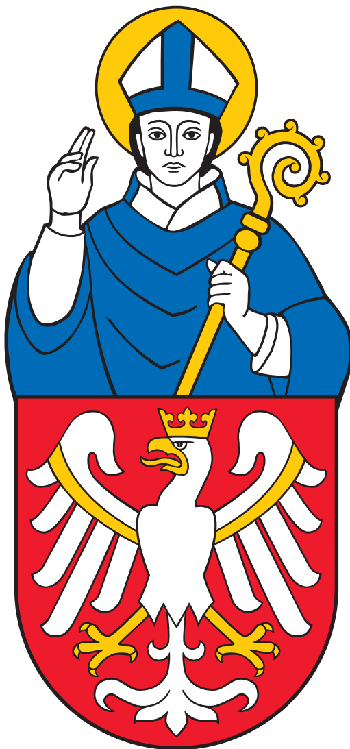
Wzór tradycyjnego herbu Uniwersytetu Jagiellońskiego