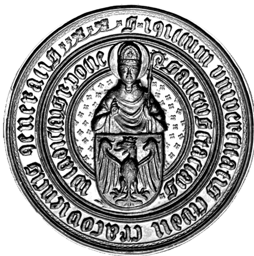
Pieczęć wielka Uniwersytetu Jagiellońskiego (średnica 65 mm)